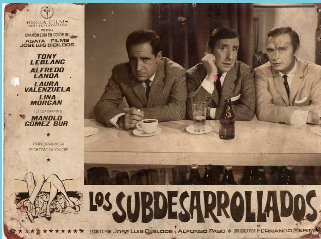
Los subdesarrollados (Fernando Merino, 1968)