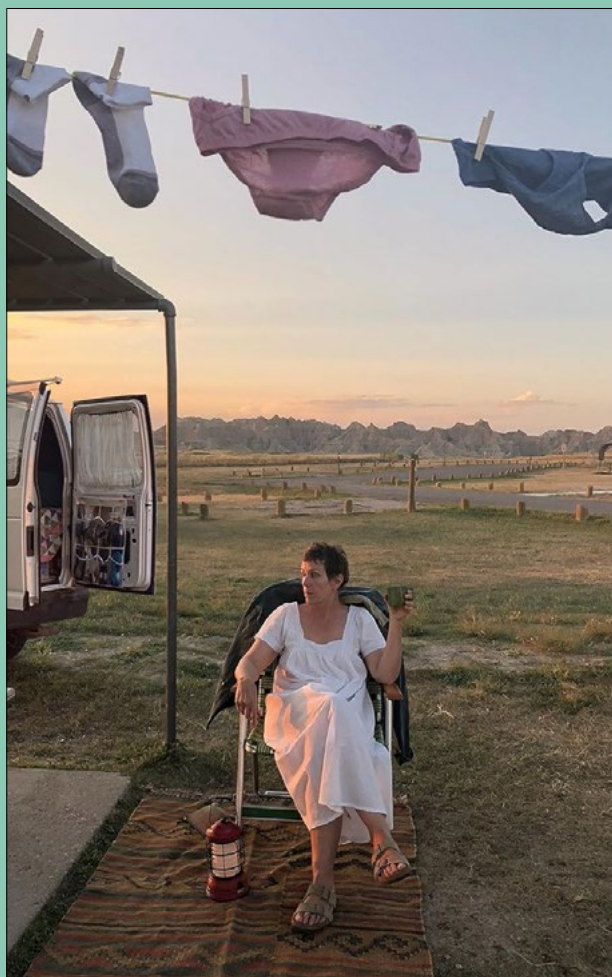
Nomadland (Chloé Zhao, 2020)