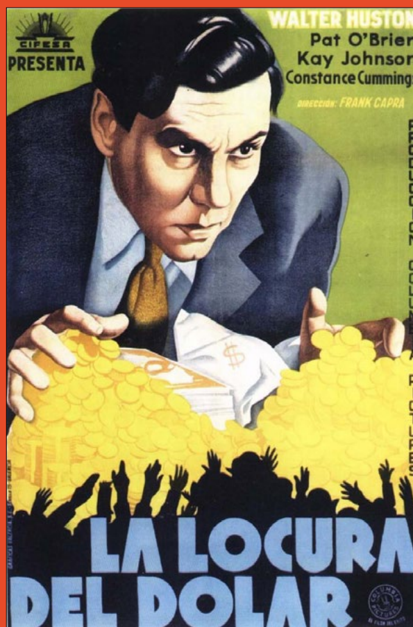
La locura del dólar (Frank Capra, 1932)

Tras dos meses de proyecciones, este enero despedimos la retrospectiva dedicada a Frank Capra, maestro de la comedia screwball y el drama humanista en el marco del Hollywood clásico. Concluimos el programa sumando nueve títulos, entre los que destacan Vive como quieras (1938), celebración de la libertad individual en clave de comedia ligera; Juan Nadie (1941), retrato de un hombre común enfrentado a la burocracia y la sociedad; Millonario de ilusiones (1959), sátira sobre la fortuna y los sueños del “self-made man” protagonizada por Frank Sinatra; La mujer milagro (1931), fábula cómica acerca de la fama y la bondad; y Un gángster para un milagro (1961), film rebotante de ironía y optimismo con el que Capra puso punto y final a una trayectoria de casi cuatro décadas.