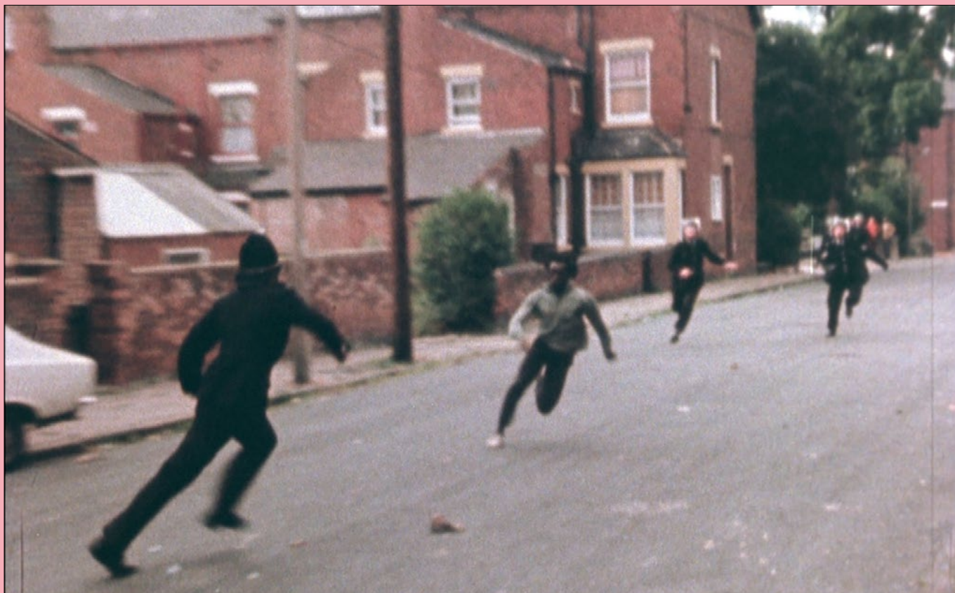
Handsworth Songs (Black Audio Film Collective, 1986).